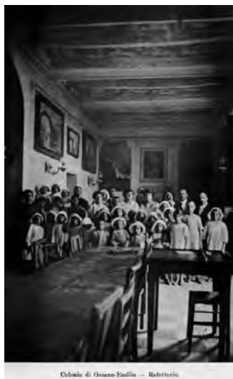
Colonia di Ozzano Emilia — Refettorio.

Villa Guidalotti oggi.