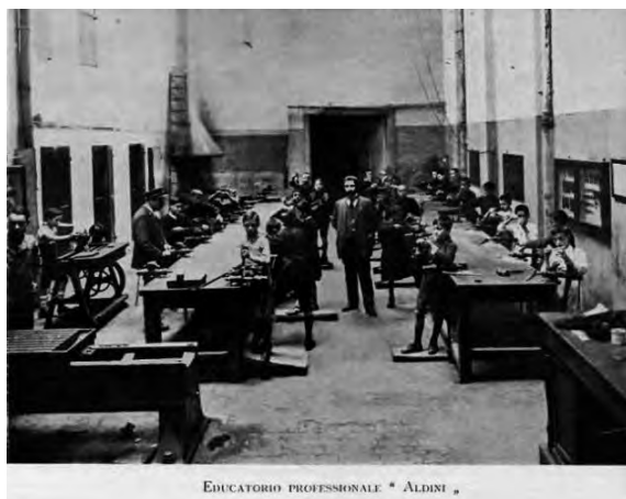
Educatório professionale «Aldini».