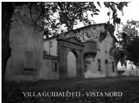
VILLA GUIDALOTTI - VISTA NORD

Colonia di Ozzano Emilia, Villa Guidalotti.