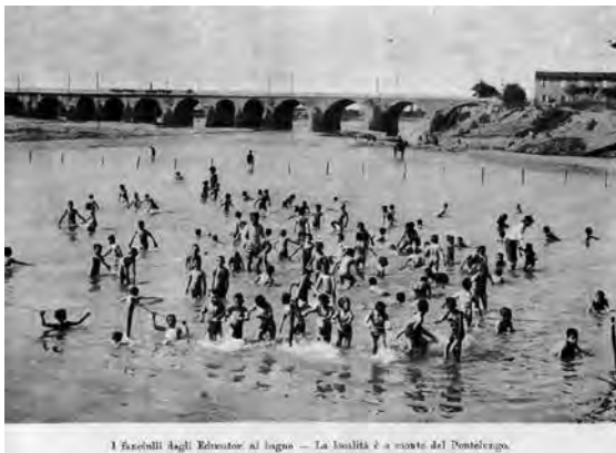
I fascioli agli Educatori al bagno — La località è a monte del Pontelungo.

I bambini degli Educatori al bagno presso il fiume Reno.