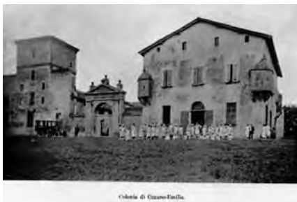
Colonia di Ozzano Emilia.

I bambini degli Educatori al bagno presso il fiume Reno.