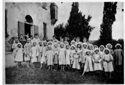
Colonia di Ozzano Emilia, Villa Guidalotti, esterno, 1915.

Villa Guidalotti oggi, interno dell'ex refettorio.