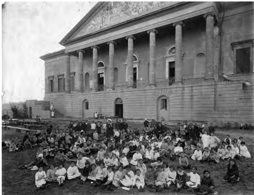
Educatório di Villa Aldini.